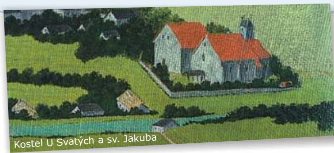
Kostel U Svatých a sv. Jakuba

Nejstarší historické zmínky o trhové a celní osadě v Domažlicích se objevují v opisu listiny knížete Boleslava II. z roku 993. Její existence byla spojena především s česko-bavorskou hranicí a významnou obchodní stezkou směřující z Čech do Řezna. V osadě stával kostel sv. Jakuba vybudovaný patrně již v 1. polovině 11. století, jehož pozůstatky byly odkryty archeologickým výzkumem.